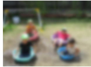
夏の終わりを楽しんだよ