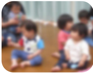
リトミック楽しいよ!