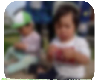
豆の取り出しに夢中!