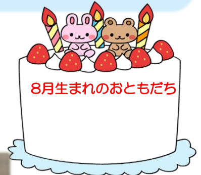
8月生まれのおともだち